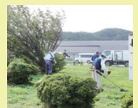
門前町老友会ボランティア