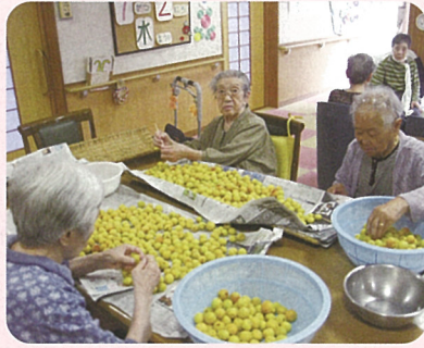
今年も梅干し作り、 美味しくできました。