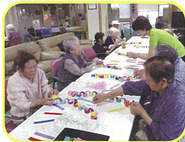
皆さんの願い事はやはり 第1位 健康長寿 でした!!