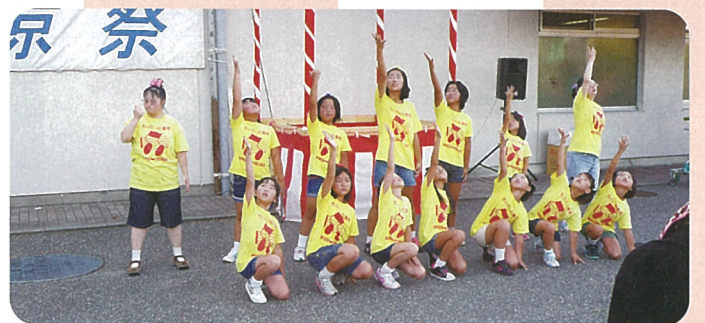
門前児童館ダンスクラブ