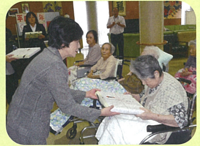
輪島市より記念品贈呈