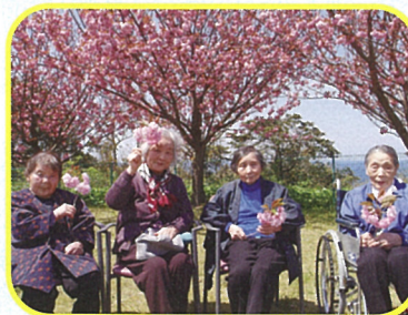
あかかみ名物八重桜 綺麗でしょ〜 私たちも桜に負けません!