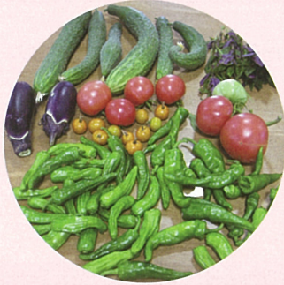
形は… 味は満点 美味しく いただきます。