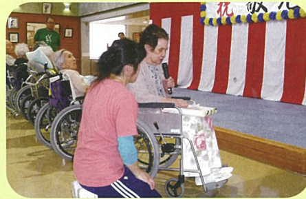
入居者代表の謝辞