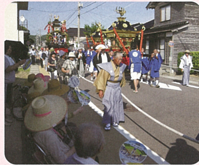
道下祭り見学。「がんばれ〜！」と 声援を送りました。