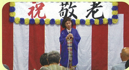
オフィスまつおか