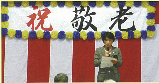
北浜輪島市福祉環境部長祝辞