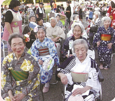
浴衣を着て納涼祭に参加しました。