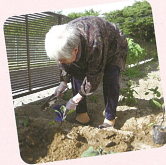
畑で野菜作り、手慣れたものです。